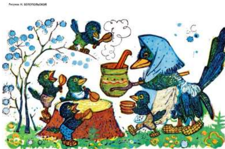
Сорока-ворона кашу варила, деток кормила

Сорока – белобока, Кашку варила, Деток кормила, (Загибание пальцев, начиная с мизинца): Этому дала, Этому дала, Этому дала, Этому дала, (Показывая на большой палец): А этому не дала. (Поглаживая его, говорят): Он дров не рубил, Воду не носил, Печку не топил, Кашку не варил. Ничего не получил!